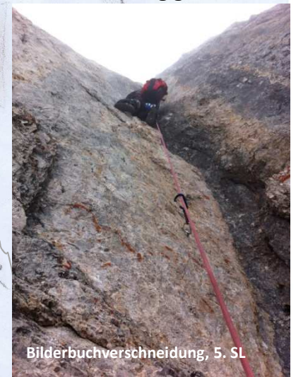
Bilderbuchverschneidung, 5. SI